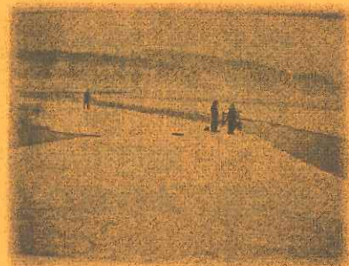
本多 庸輔様：尾瀬沼(H12.5 GW)

今後も絵・写真の募集をさせていただきますので、展示可能な作品がある方はぜひご持参ください。また、ご不明な点がございましたらお気軽にお問い合わせください。