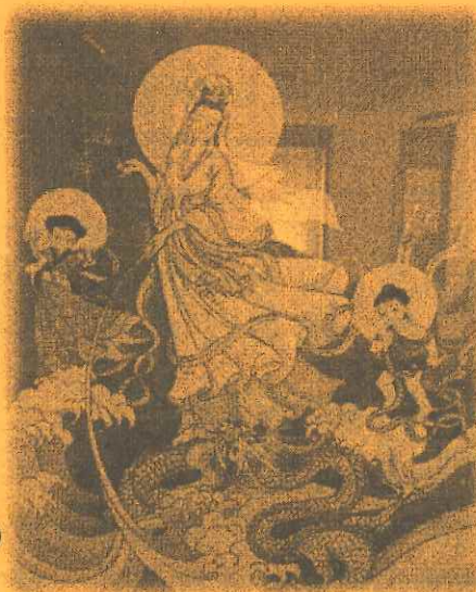
関口 喜美子様作：天女(タイ刺繍)