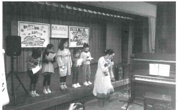
<越生東2区サロンの様子>

平成30年1月28日に大満区集会所にて作品展示会が行われました。大満地区サロンでは、1年間作り貯めた作品を展示し、サロン活動のPRを行いました。折り紙の薬玉や卵の殻のお雛様、洗濯バサミの猫等々。色とりどりの手芸品は、作り手の温かみを感じられます。子ども会や地区内の手芸や工芸の得意な方の作品も飾られ、会場いっぱい素敵なお品が並んでいました。普段の地区サロンと同様にテーブルと座布団を用意し、皆でお茶を飲みながら、展示品の話題で盛り上がっていました。大満区だけでなく、他の区からもお客さんが見え、賑やかな展示会となりました。