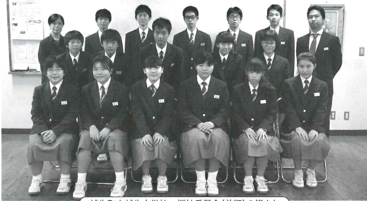
越生町立越生中学校 福祉委員会(前期)の皆さん

この度、越生町立越生中学校の福祉委員会より、『平成30年北海道胆振東部地震災害義援金』として、合計35,120円をお預かりしました。福祉委員会の皆さんは、1年生から3年生までの合計18人で活動をされています。普段は、ペットボトルキャップの収集や校内清掃等の活動をされていますが、今回は北海道で発生した地震の報道を目の当たりにして、自分たちもジュース1本を買わない等、生活の中で少しの我慢をすることで、被災地の力になろうと、全校に呼びかけ募金活動を行っていただきました。多くの生徒さんにご協力をいただいた義援金については、町内の他の義援金と合わせ被災地に送らせていただきました。※平成30年度北海道胆振東部地震災害義援金の詳細につきましては、P4をご参照ください。