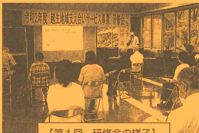
【第1回 研修会の様子】

各グループでアイデアを出し合いながら調理をしていただき、麻婆風鶏肉炒めやかじきの照焼き、 肉じゃがなど、どの班もバラエティーに富んだメニューが出来上がりました。