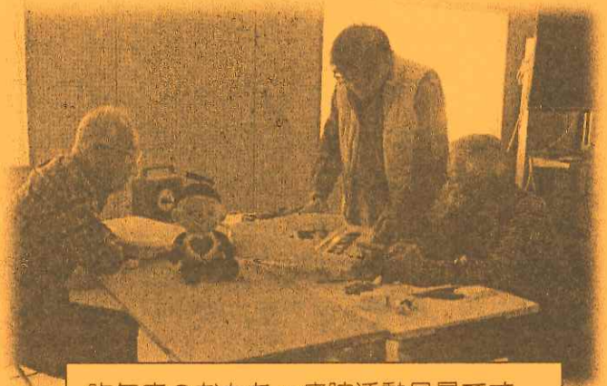
昨年度のおもちゃ病院活動風景です。